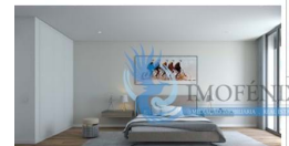
eriores | Interior Views Principal - Master Bedroom | Instalação Sanitária - Master Bathroom