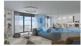
erior Views Living Room | Sala de refeições - Dining Room | Cozinha - Kitchen